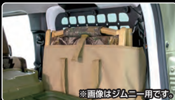
※画像はジムニー用です。

上部ステーにはM8サイズの横長スリットを設け、M8アイボルトやハンガーを掛ける事が可能