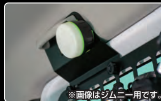
※画像はジムニー用です。