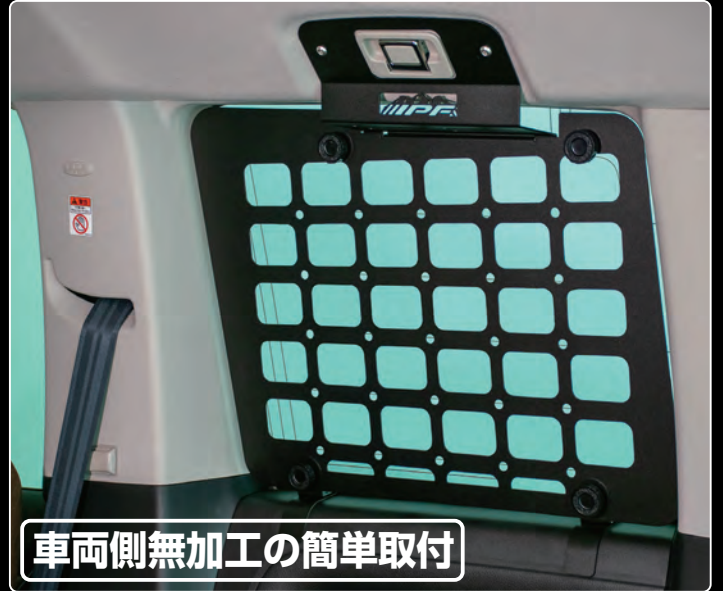
車両側無加工の簡単取付