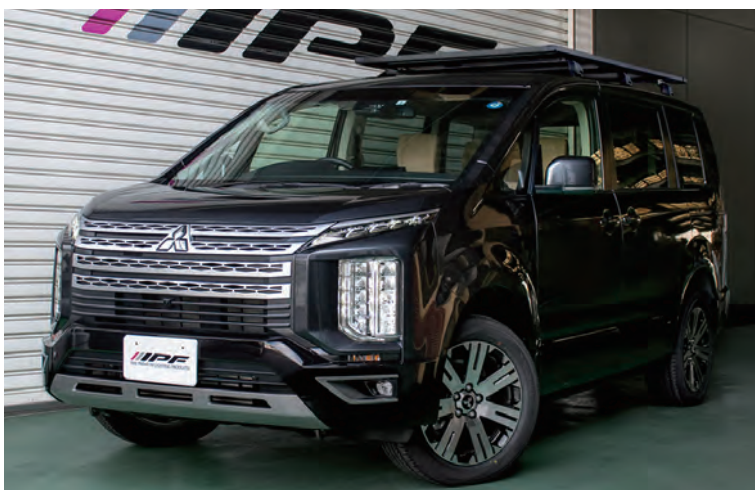
●デリカD:5ノーマル車両 装着イメージ

●軽量アルミ製フレーム採用 ●樹脂製コーナーカバー(ロゴ入り) ●EXR-03L 三菱デリカD:5用レッグ ●重量：3.7kg(レッグ6 本総重量)