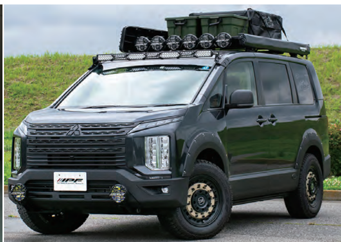
●EXPルーフラック各種オプション(別売) 装着イメージ